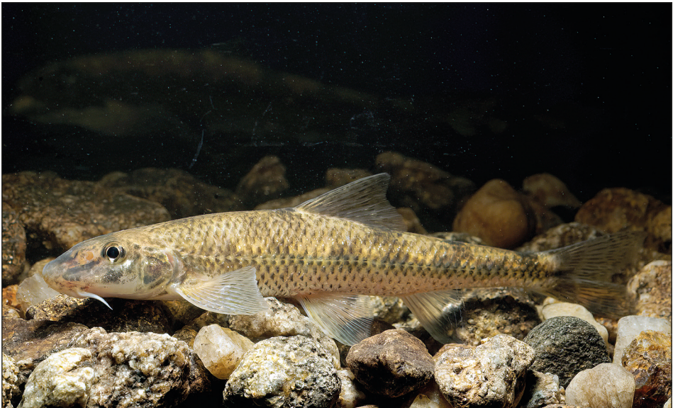
Abb. 3: Adulter Smaragdgressling ( Romanogobio skywalker ). © Clemens Ratschan – Fig. 3: Adult emerald gudgeon ( Romanogobio skywalker ). © Clemens Ratschan.

(Ratschan et al. 2021). Gründlinge der Gattung Gobio sind in Österreich laut Roter Liste (Wolfram & Miksch 2007) mit einer Art, dem Gründling, G. gobio (Linnaeus, 1758), bzw. laut Kottelat & Freyhof (2007), mit zwei Arten, G. gobio im Nordwesten und dem Donau-Gründling, G. obtusirostris (Valenciennes, 1842), im Osten und Süden, mit einer potentiellen Hybridzone in der Oberen Donau, vertreten. Tatsächlich stellt sich die Situation viel komplexer dar, mit einer natürlichen, durch nacheiszeitliche Kolonisierungsprozesse bedingten Hybridzone, die zumindest die gesamte Osthälfte Österreichs umfasst und nicht nur Gründling und Donau-Gründling beherbergt, sondern auch eine dritte, noch unbeschriebene Art bzw. divergente genetische Linie, die nah verwandt ist zu einigen am Balkan vorkommenden Arten (Zangl et al. 2020). Die exakten Verbreitungsgrenzen der einzelnen Arten / Linien sind noch nicht bekannt.